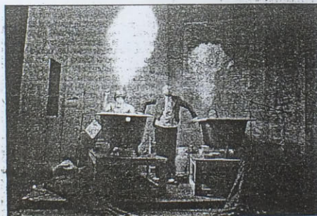
Predstava literarnega gledališča Artikulator "Stoživka" na Metelkovi.

Jutri bodo odprli razstavo karikatur Franca Jurija in predstavili strip, Sarajevo tango avtorja Hermana (Kud France Prešerna ob 21. uri), zvečer ob 22. uri bo koncert dueta Zlata jama na Metelkovi, uro pozneje bodo predvajali dokumentarni film Vidimo se v Čtuli režiserja Janka Beljaka (produkcija B-92), sledila bo modna revija Reciklaža avtorja Dominika Zvera ter zabavni program Reciklaža show (Gerbičeva 51/a). O prireditvah v sredo in četrtek bomo še poročali. (J. S. A.)