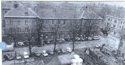
Nekdanja vojašnica ne bo več dolgo prazna.

bi bili pristojni za opredelitev namembnosti vojašnic. Na teh sestankih so bili sprejeti sklepi, iz katerih je jasno, da so bili Mreži dodeljeni zaledni deli bivše vojašnice na Metelkovi, to je severna tretjina kompleksa ob Masarykovi ulici. Ta si-